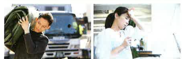
個包装は業務用のみとなります。 ※チャート図は商品の特徴をイメージ化したものです。