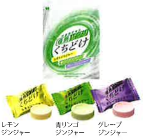
レモン ジンジャー 青りんご ジンジャー グレープ ジンジャー