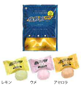
レモン ウメ アセロラ